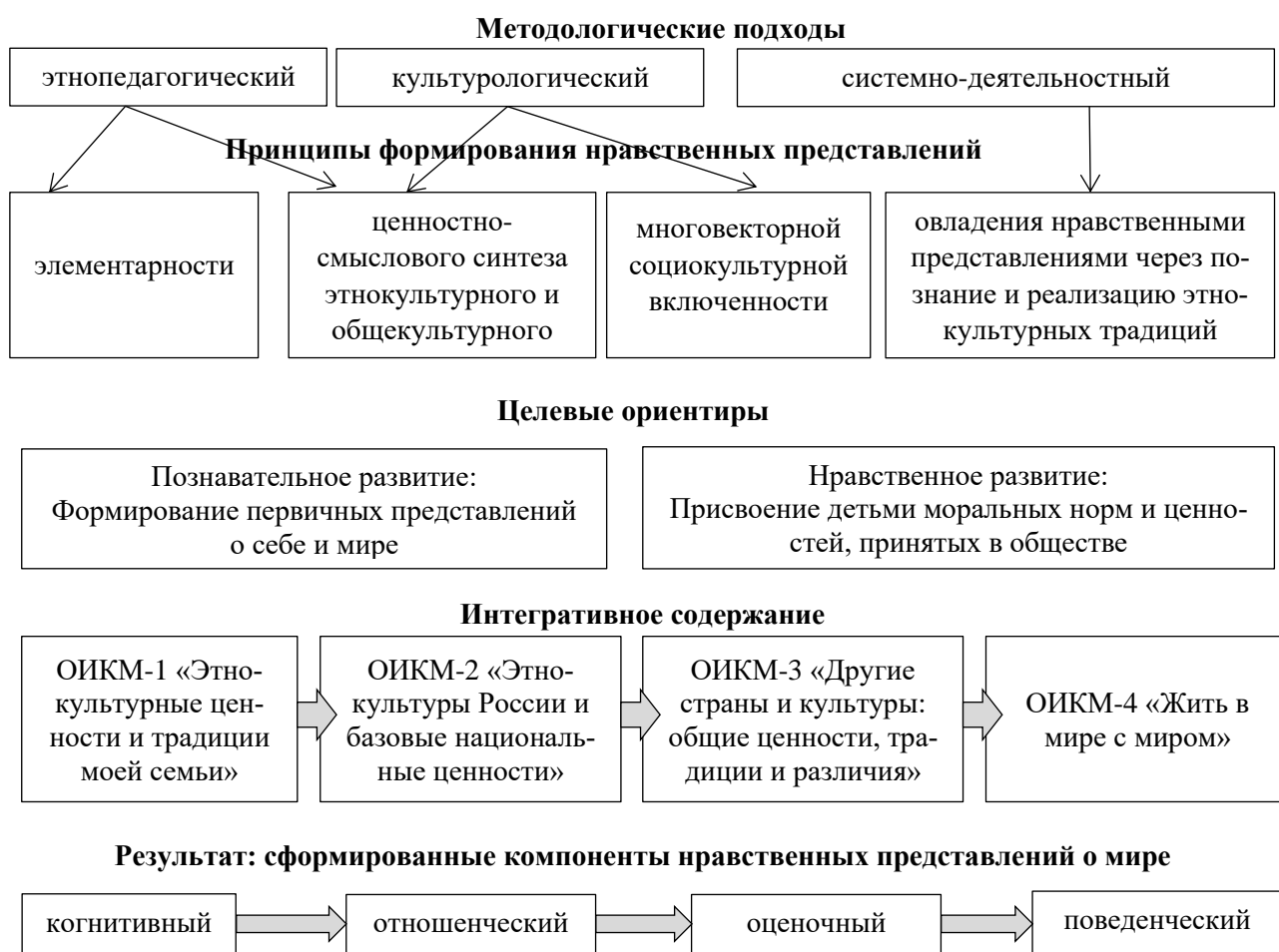
Рис. 1. Ценностно-целевая модель формирования нравственных представлений старших дошкольников о мире

Разработана ценностно-целевая модель формирования у старших дошкольников нравственных представлений о мире (см. рис.1).