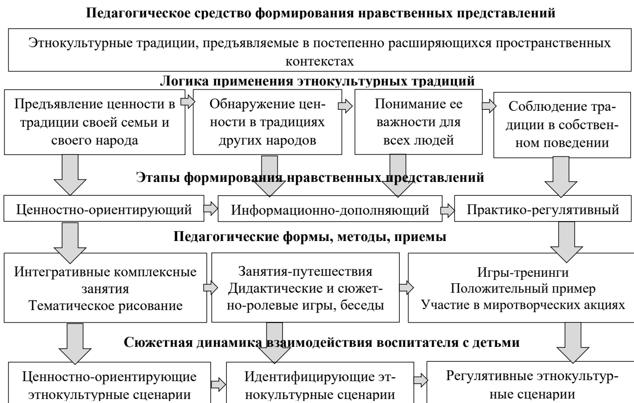
Рис. 2. Технология формирования нравственных представлений старших дошкольников (многовекторной социокультурной включенности ребенка)

– сюжетную динамику взаимодействия воспитателя с детьми : ценностно-ориентирующие, идентифицирующие, регулятивные этнокультурные сценарии (см. рис. 2).