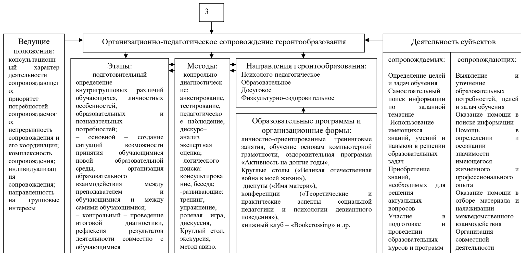
Рисунок 1 – Системная организация геронтообразования